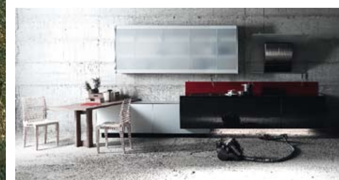
VALCUCINE, Riciclantica Sportech Valcucine has been leading the way with dematerialized and recyclable products that are guaranteed to last and without formaldehyde emissions or using wood sourced from primary forests. The Riciclantica kitchen with Sportech doors have an extremely technological appearance achieved by bonding a 2-mm thick glass door with a carbon fiber fabric one Valcucine è da sempre in prima linea con prodotti dematerializzati e riciclabili, a emissione zero di formaldeide, che garantiscono una lunga durata tecnica ed estetica e legni non provenienti dalla distruzione delle foreste primarie. Così, la cucina Riciclantica con l'anta Sportech si compone di un pannello tecnologico che prende vita dall'accoppiamento di un'anta in vetro di 2 mm con un tessuto in fibra di carbonio valcucine.it