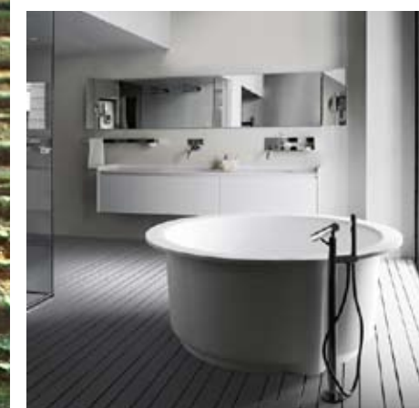
AGAPE, Cristalplant® Biobased Presented by Nicos International exclusively for Agape, Cristalplant® Biobased is the first eco-sustainable solid surface of plant origin mixed with the purest natural inert minerals. It can be used in numerous applications, including the EVO evolution-collection Presentato da Nicos International in esclusiva per Agape, Cristalplant® Biobased è il primo solid surface ecosostenibile derivante da materie prime vegetali miscelate a minerali inerti naturali di estrema purezza. Utilizzato per numerose collezioni dell'azienda mantovana, tra cui la collezione-evoluzione EVO agapedesign.it