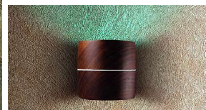
FDV GROUP, Wood Design Decoma Design The solid wood lamp made by I Tre, a Fdv Group brand, offers innovative features and its cone shape makes it an excellent loudspeaker. Wood uses Dual Inside Sensai technology developed with the company Check-up to integrate music and sounds into an electronic device based on white light and RGB and controlled through a remote control La lampada in legno massello prodotta da I Tre, brand di Fdv Group, si rinnova grazie alla forma conica che funge da cassa acustica. Wood sfrutta la tecnologia Dual Inside Sensai sviluppata con l'azienda Check-up che consente di integrare all'interno di una scheda elettronica, gestita in wireless tramite un telecomando, musiche e suoni provenienti da un supporto esterno con luci bianche e RGB fdvgroup.com