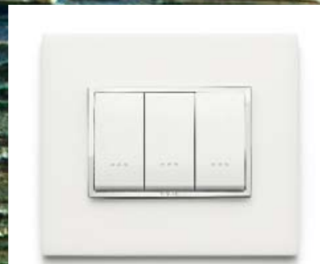
VIMAR, Eikon Evo With thin profiles and cutting-edge color combinations, the new Eikon Evo cover plates come in seven different materials: aluminum alloys, stone, Corian® (pictured here), wood, crystal, leather and total aluminum and crystal. Applied to the By-me automation system, the solution also features new touchscreen videos and functions that monitor the climate in real time and calculate energy consumption. The web interface means that the functions can be managed via PC, smartphone or tablet Profili sottili e accostamenti cromatici inediti per le nuove placche Eikon Evo che lasciano spazio ai materiali, nelle sette varianti: alluminio anodizzato, alluminio nobilitato, pietra lavorata, Corian® (in foto), legno massello, cristallo, pelle naturale e nella versione total alluminio e cristallo. Applicata alla tecnologia domotica By-me, tramite PC, smartphone o tablet vimar.it

Una collezione che trae ispirazione dal legno, tanto nei colori quanto nelle sfumature cenere, cotone, canapa, corteccia e cocco. Presentata all'ultimo Cersaie, Linfa è una grande novità anche nella larghezza con il formato dedicato lastra-listone 143x1500 mm che si affianca alle tradizionali misure 1x3 m e a soluzioni personalizzate fino a 3 m di lunghezza, conservando sempre il caratteristico spessore di 3 mm. Interamente naturale e riciclabile, è durabile nel tempo e altamente resistente agli agenti atmosferici e al fuoco laminam.it