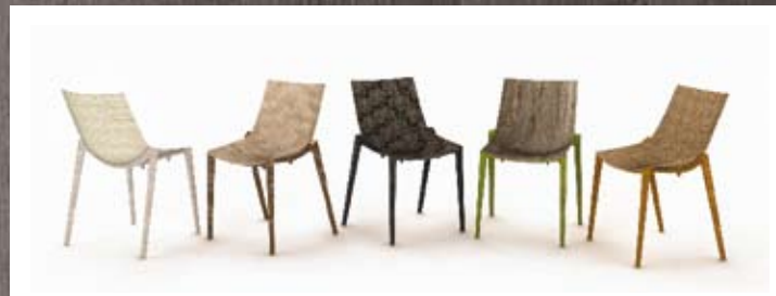
MAGIS, Zartan Design Philippe Starck, Eugeni Quitllet Beyond plastic. Presented during the last Salone del Mobile in Milan, Zartan is an entirely "green" chair made of natural materials, including hemp, bamboo, linen and natural glue. Oltre la plastica. Presentata in occasione dello scorso Salone del Mobile, Zartan è una seduta interamente "green", realizzata con materiali biologici quali canapa bambù, lino e colle naturali magisdesign.com